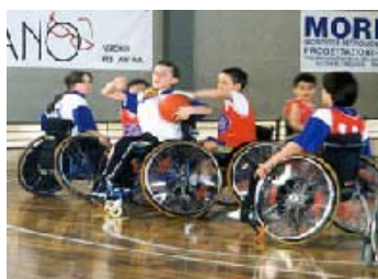
POLISPORTIVA DIVERSABILI "I DELFINI" Montecchio M.

Strada Mora 93 - 36100 Vicenza - tel. 0444 923446